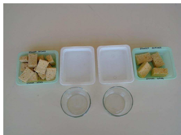
Le test des éponges

CENTRE PERMANENT D'INITIATIVES POUR L'ENVIRONNEMENT