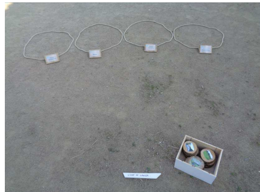
Le phot'eau palet