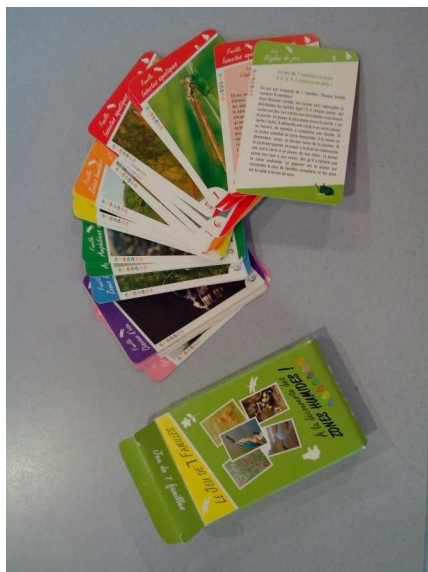
Le jeu de 7 familles