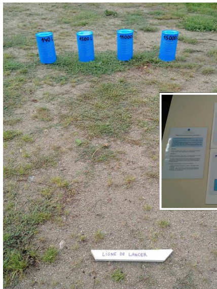
Le chamboule-tout « eau cachée »