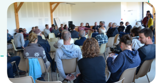
> Les structures adhérentes au CPIE