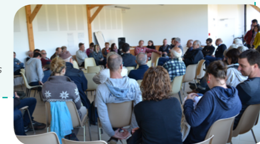
> Les structures adhérentes au CPIE