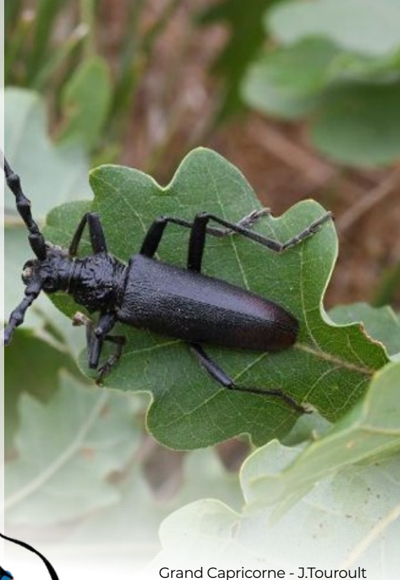
Grand Capricorne - J.Touroult